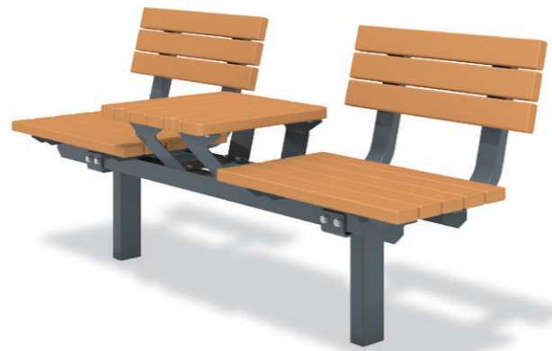
RBF-1710（センターテーブルタイプ） ¥330,000+消費税