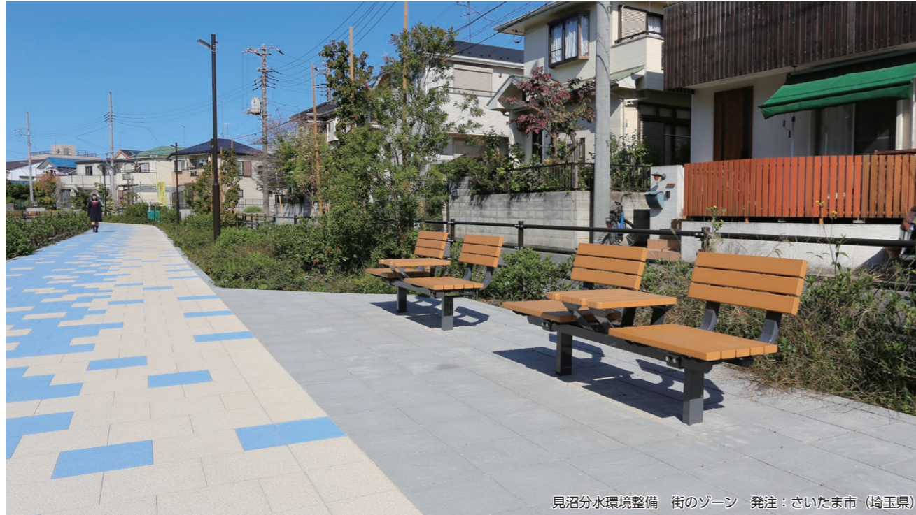
見沼分水環境整備 街のゾーン 発注：さいたま市（埼玉県）

荷物を置いたりランチを食べやすい等、大きめのテーブル付きで便利なベンチシリーズです。