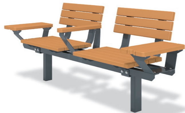
RBF-1720（サイドテーブルタイプ） ¥360,000+消費税