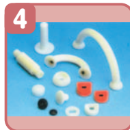
4. ナイロンパーツ すべてのナイロンパーツは耐衝撃性 ナイロン樹脂を採用しています。