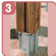
3. 埋込鉄脚 スチール製鋼管溶融亜鉛メッキ仕上