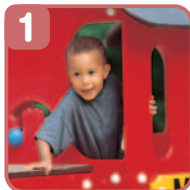
1. ポリエチレンパネル 高密度ポリエチレン樹脂板