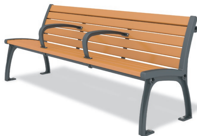
RBA-1362 (W=1800) ¥244,000+消費税