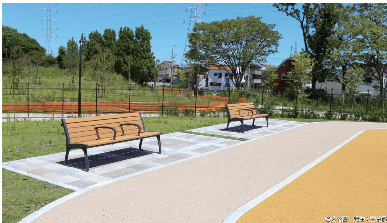
舎人公園 発注：東京都

様々な景観に合うスマートなデザインが特徴のベーシックモデルのベンチシリーズです。