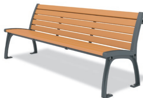
RBA-1360 (W=1800) ¥224,000+消費税