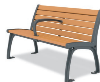
RBA-1341 (W=1200) ¥196,000+消費税