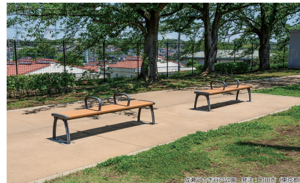
成瀬うさぎ谷戸公園 発注：町田市（東京都）