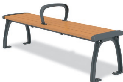
RBA-1451 (W=1500) ¥145,000+消費税