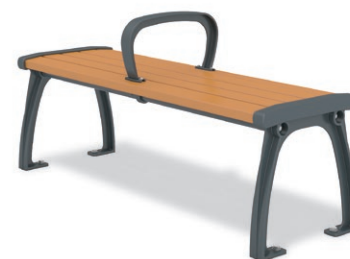
RBA-1441 (W=1200) ¥135,000+消費税