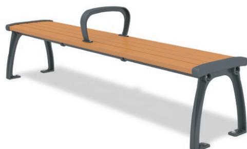
RBA-1461 (W=1800) ¥155,000+消費税