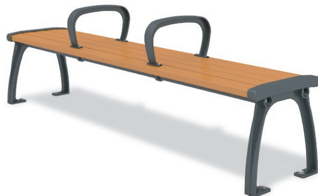
RBA-1462 (W=1800) ¥165,000+消費税