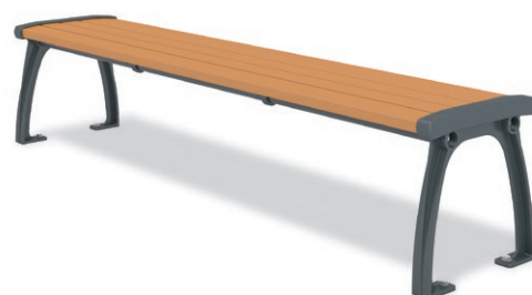
RBA-1460 (W=1800) ¥145,000+消費税