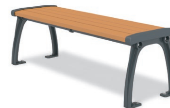
RBA-1440 (W=1200) ¥125,000+消費税