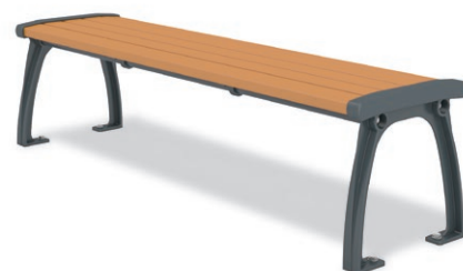
RBA-1450 (W=1500) ¥135,000+消費税