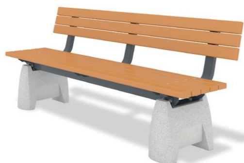
RBT-1330 (W=1800) ¥280,000+消費税