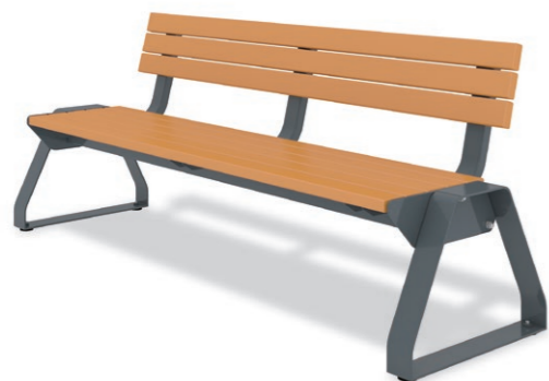
RBF-1360 (W=1800) ¥260,000+消費税