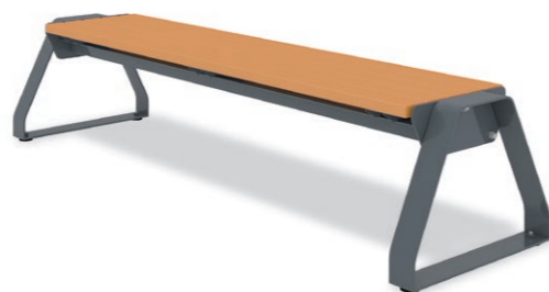
RBF-1460 (W=1800) ¥208,000+消費税