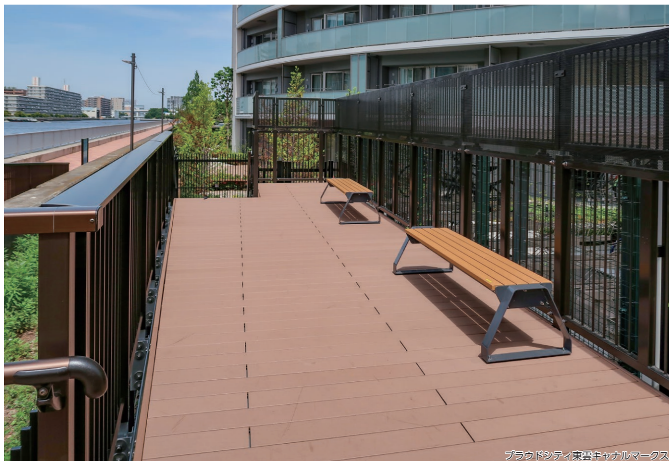
プラウドシティ東雲キャナルマークス

軽量で運びやすいフレーム脚と安定感ある擬石脚の2種類がある、置式ベンチシリーズです。