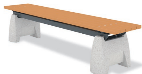
RBT-1430 (W=1800) ¥214,000+消費税