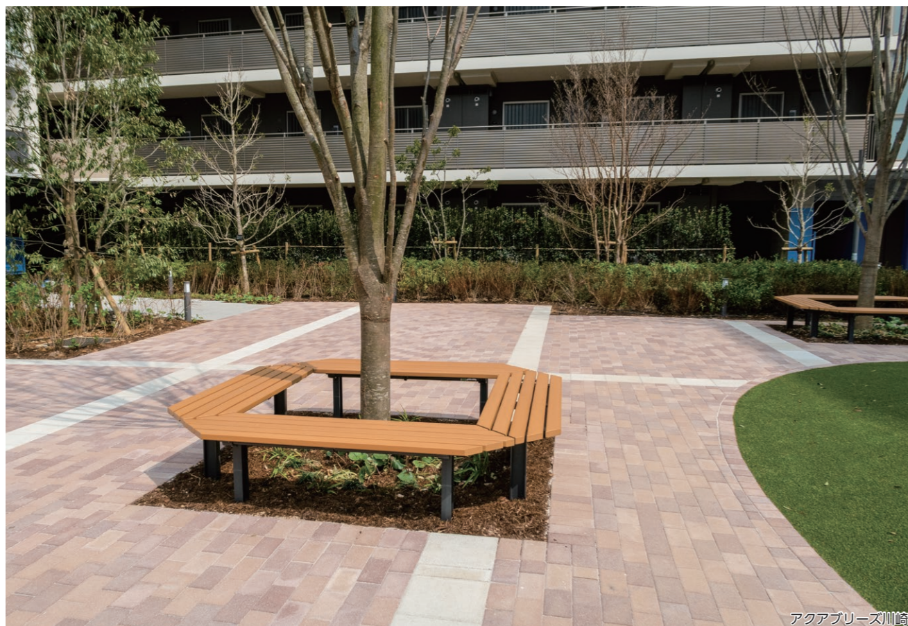
アクアブリーズ川崎

直線を基調としたスクエア型のサークルベンチです。景観を効果的に演出することができます。