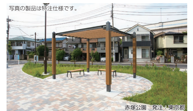
写真の製品は特注仕様です。