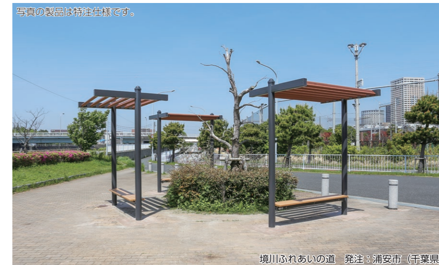
境川ふれあいの道 発注：浦安市 (千葉県)

休憩施設の鋼材に溶融亜鉛メッキを施して耐久性を格段に高め、製品の長寿命化につなげています。(▶p.61)