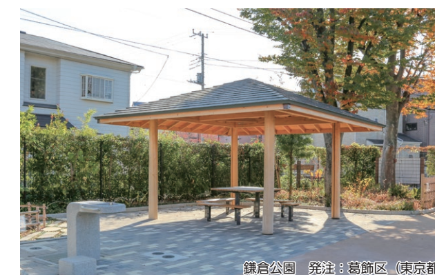
鎌倉公園 発注：葛飾区 (東京都)