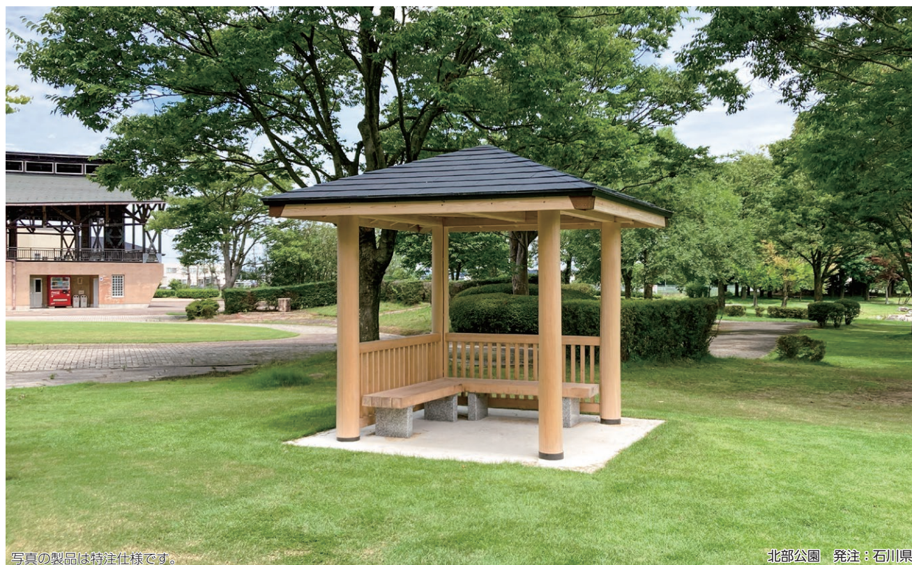
写真の製品は特注仕様です。